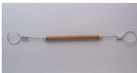
DA Largo 26,1 cm. Entre centros.