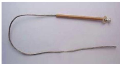
CC Largo total 58 cm.

Los hilo fusibles mayores de 100[A] no caben en el desconector de 100 [A].