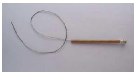
FC Largo total 58 cm.